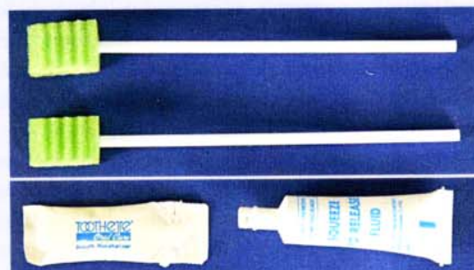
Abb. 1 Toothette (Fa. TapMed)

ments. Durch eine kontinuierliche Surveillance können Infektionsprobleme erkannt werden, die möglicherweise vorhandene Defizite der Struktur- und